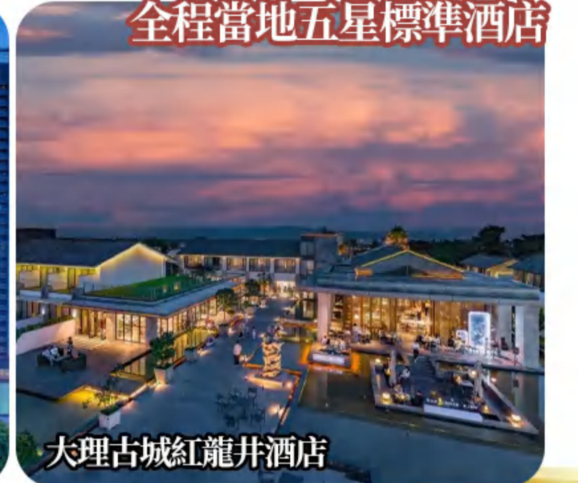
大理古城紅龍井酒店