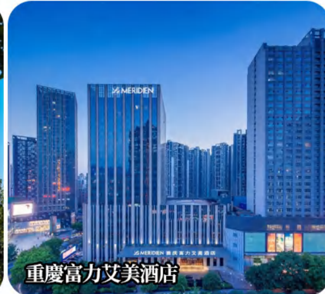
重慶富力艾美酒店