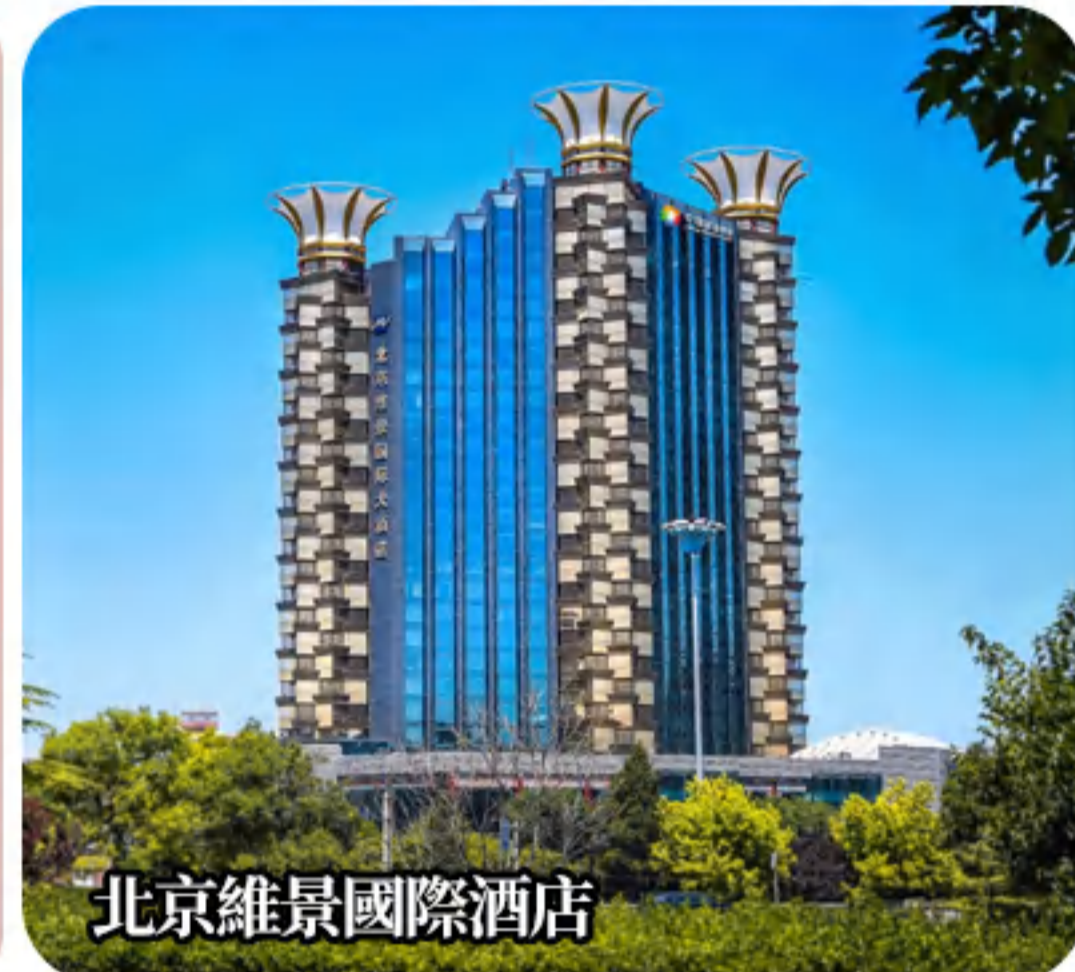
北京維景國際酒店