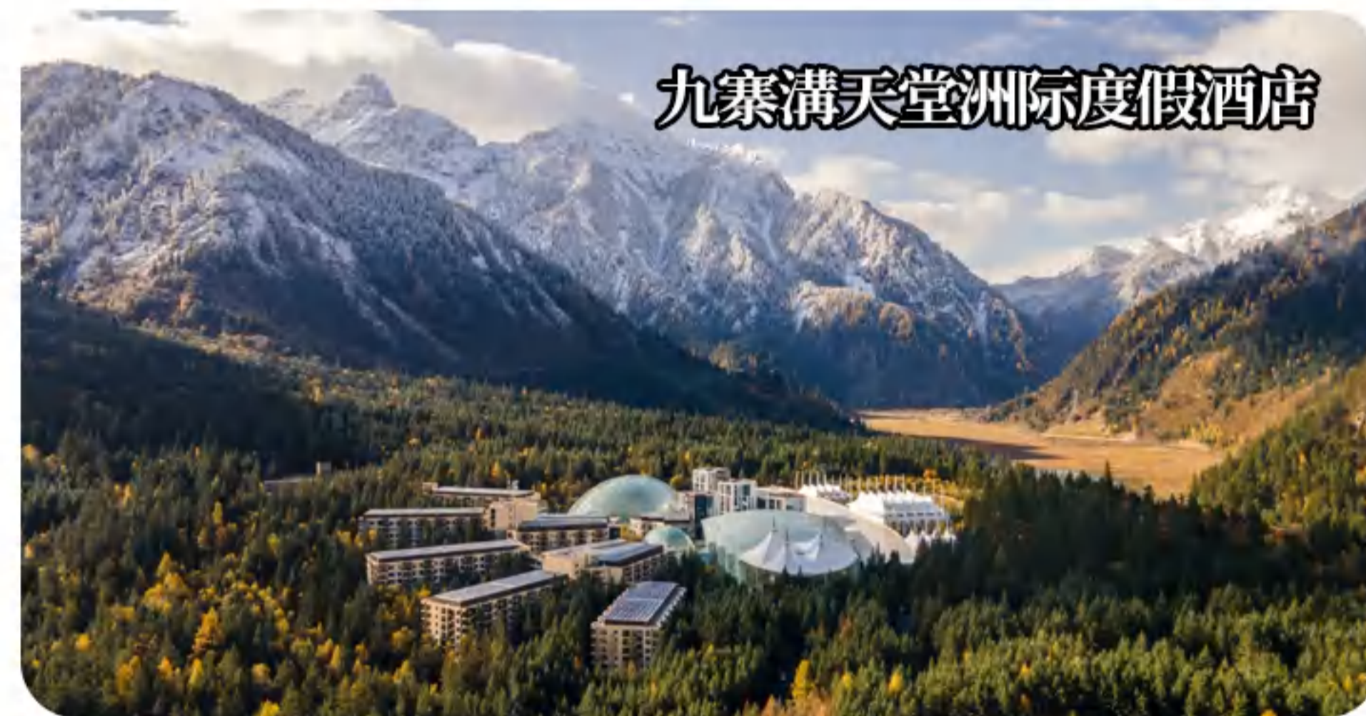
九寨溝天堂洲際度假酒店