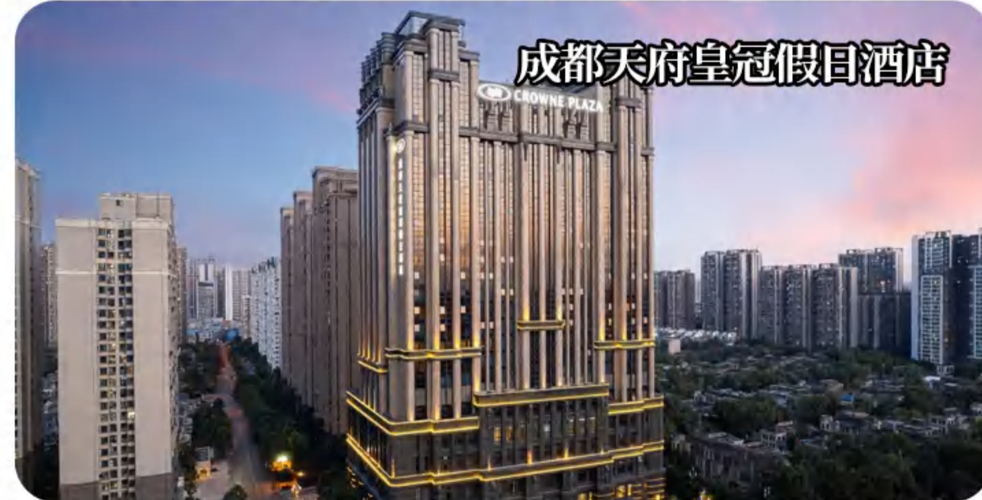
成都天府皇冠假日酒店