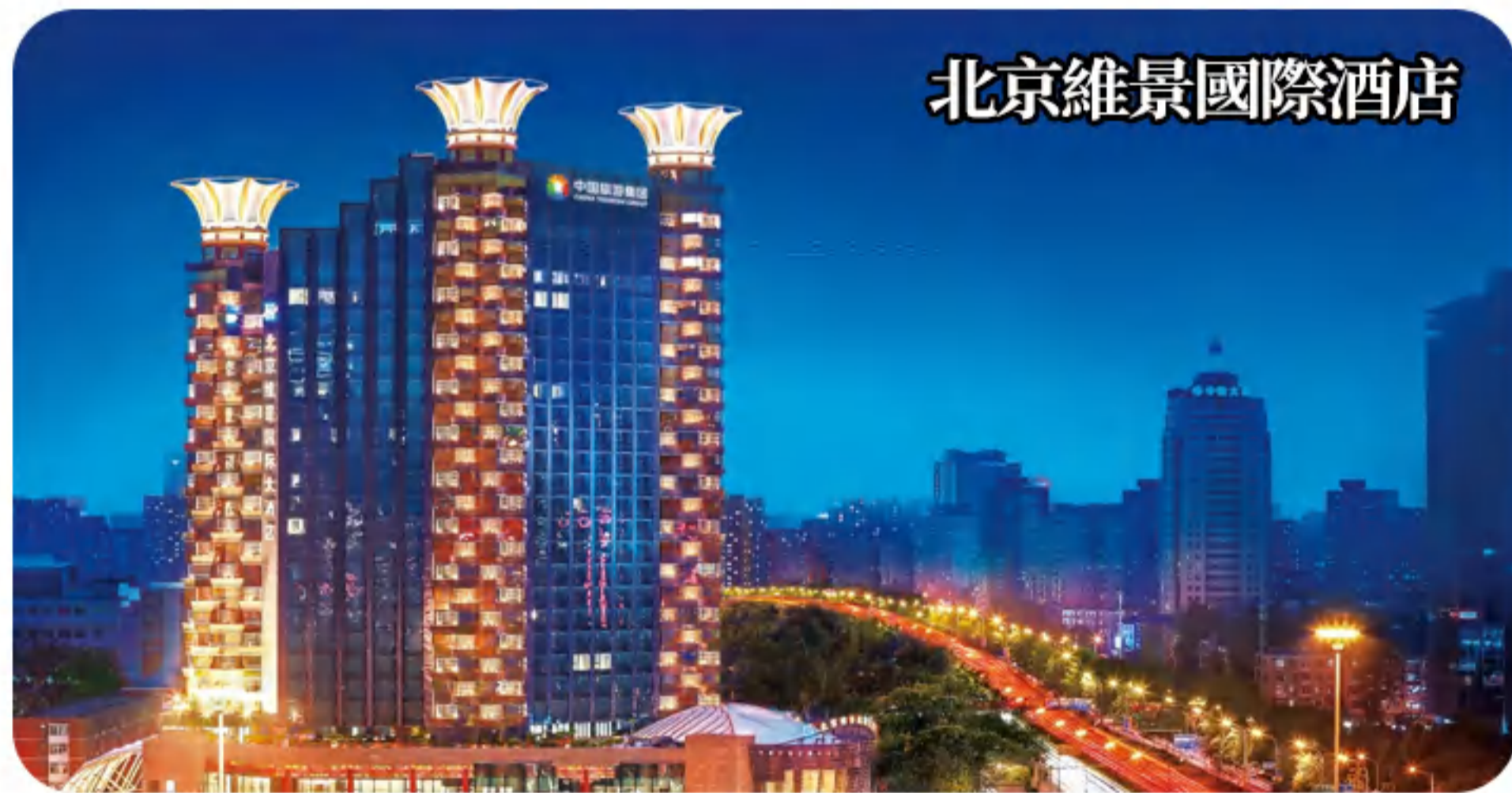
北京維景國際酒店