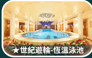
★世紀遊輪-恆溫泳池