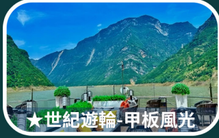
★世紀遊輪-甲板風光