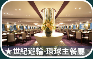
★世紀遊輪-環球主餐廳