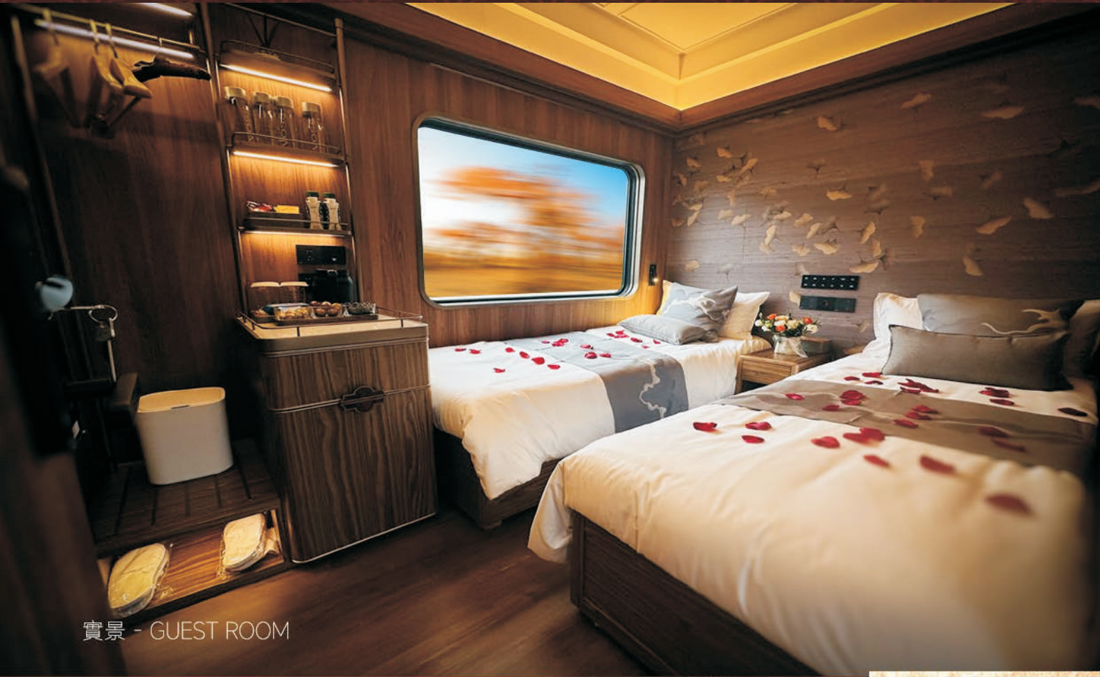
實景 - GUEST ROOM