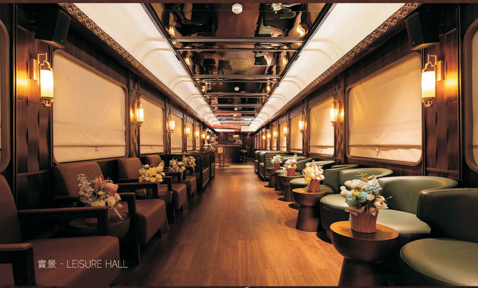
實景 - LEISURE HALL