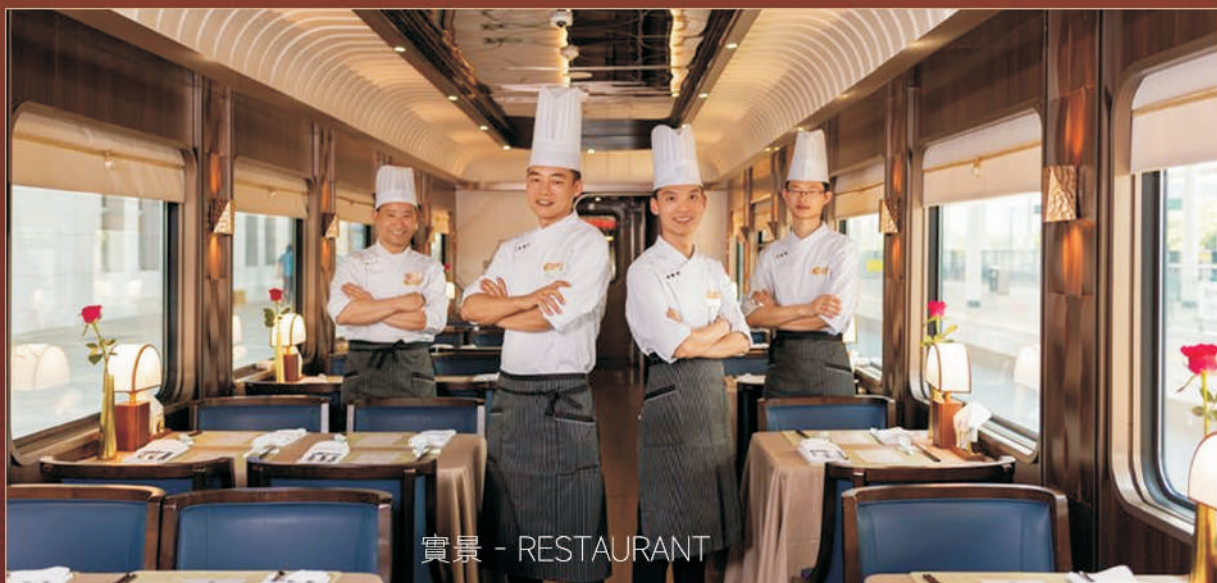
實景 - RESTAURANT

廚師團隊由深耕高端餐飲領域20餘年的明星主廚領銜， 匯聚來自知名烹飪學府與地域美食專家的優秀成員，為您打造以粵菜、 新川菜為主的高品質美味...盡享美食美景愜意旅途時光