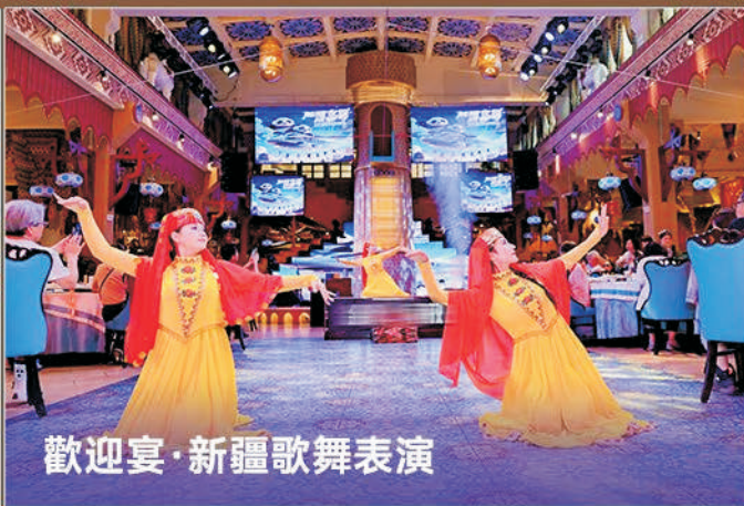
歡迎宴·新疆歌舞表演