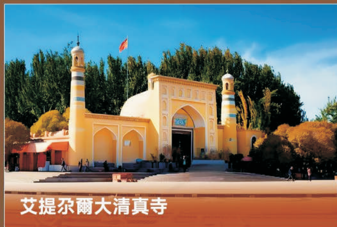
艾提尕爾大清真寺