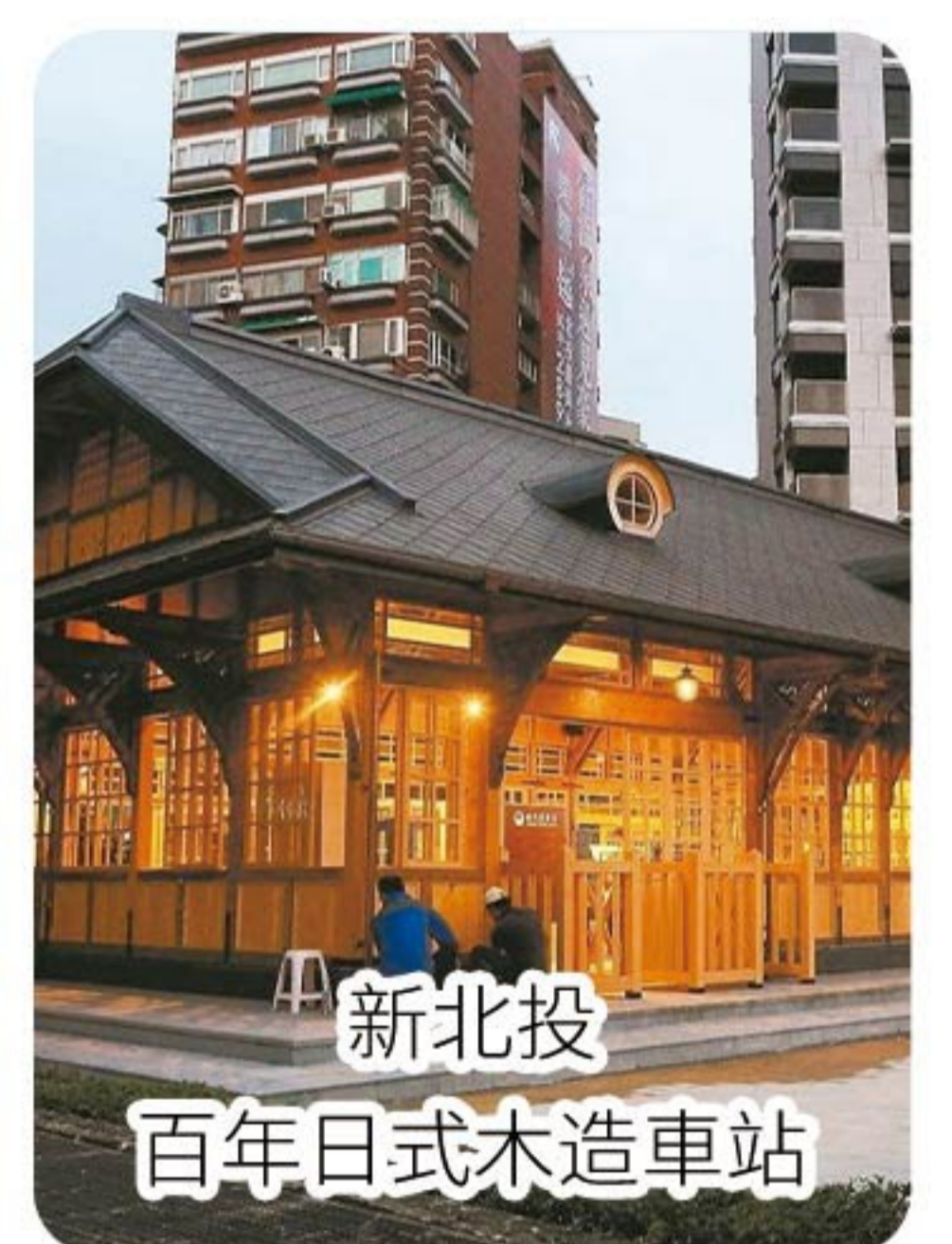
新北投 百年日式木造車站