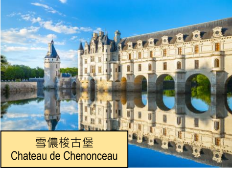
雪農梭古堡 Chateau de Chenonceau

自助式早餐後，前往 雪農梭古堡 ，安排進入參觀。古堡建於1524年，又名 “淑女城堡” ，是羅瓦爾河流域最著名的 “橋上之堡” ，以橫跨察爾河的197呎長拱型橋樑最為著名，從河岸遠眺整個城堡如同浮在水中，莫怪乎又有 “堡后” 的美譽。特別安排，於雪農梭古堡區享用午餐。餐後，探訪河谷區內之 昂布瓦斯 市鎮，先行參觀當地著名的 克洛呂斯城堡 。這是一座充滿典型文藝復興時期風格的古堡，於1516年達芬奇應弗朗索瓦一世之邀，帶同他最鍾愛的二幅作品：《蒙娜麗莎》、《聖·安娜》和《聖·巴蒂斯特》入主城堡，至今城堡內仍保留著達芬奇時代的家具陳設。繼續車程至 羅瓦爾河谷區 ，那是法國著名葡萄酒產區。晚餐自備。 (早、午餐) 住宿：Mercure Hotel 或同級