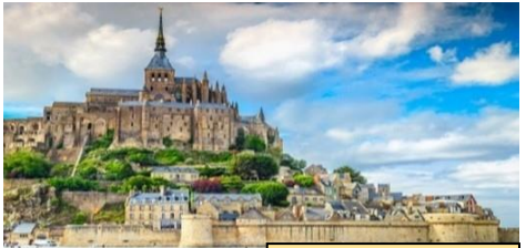
聖米歇爾山 Mont Saint Michel

自助式早餐後，驅車往 聖米歇爾山 及進入遊覽。於1979年被聯合國教科文組織列為世界文化遺產。它座落於海拔88米高的一個小山丘；退潮時週邊一片沙石灘塗，與大陸相連。當每日漲潮時，灘塗被水淹沒，會呈現海中孤島的美麗幻景。建在山上之 修道院 ，保持有中世紀風格結構，非常壯觀，建築期歷時五百年，極為精細尤如博物館。午餐自備。稍後，開始諾曼第歷史之旅，親訪區內的 濱海聖洛朗 ，與它一步之遙的 奧馬哈海灘 是第二次大戰時的重要戰場。1944年6月6日早上開始，西方盟軍展開一場大規模攻勢，史稱 “D-Day” 搶灘登陸戰。當日戰役激烈，傷亡至巨。遊畢，乘車前往剛城，另一個在諾曼第區內飽歷戰火洗禮的城鎮。晚餐於當地餐廳。 (早、晚餐) 住宿：Mercure Hotel 或同級