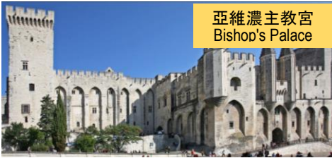
亞維濃主教宮 Bishop's Palace